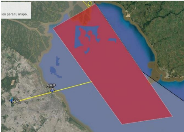
Figura / Figure 2 – TSA RÍO