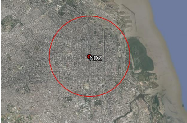
Figura / Figure 3 – SAP DRONE